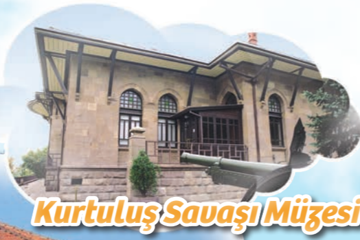
Kurtuluş Savaşı Müzesi